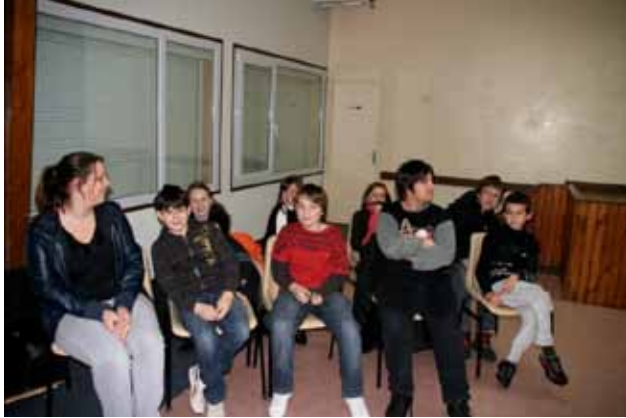
Le conseil municipal des jeunes