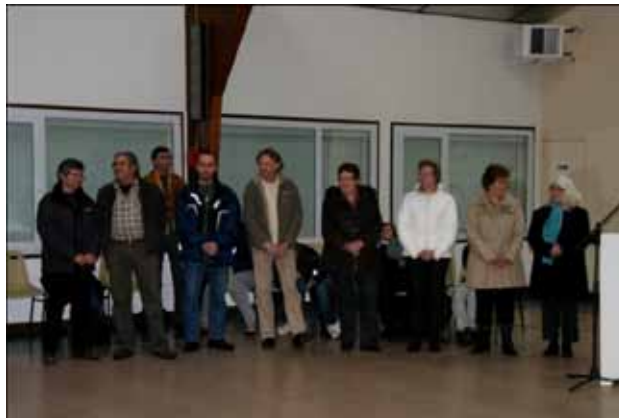
Les médaillés du travail, promotion 2010