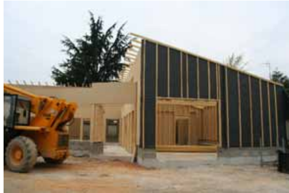
Avancement des travaux début avril 2011