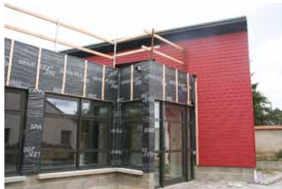
Avancement des travaux début septembre 2011