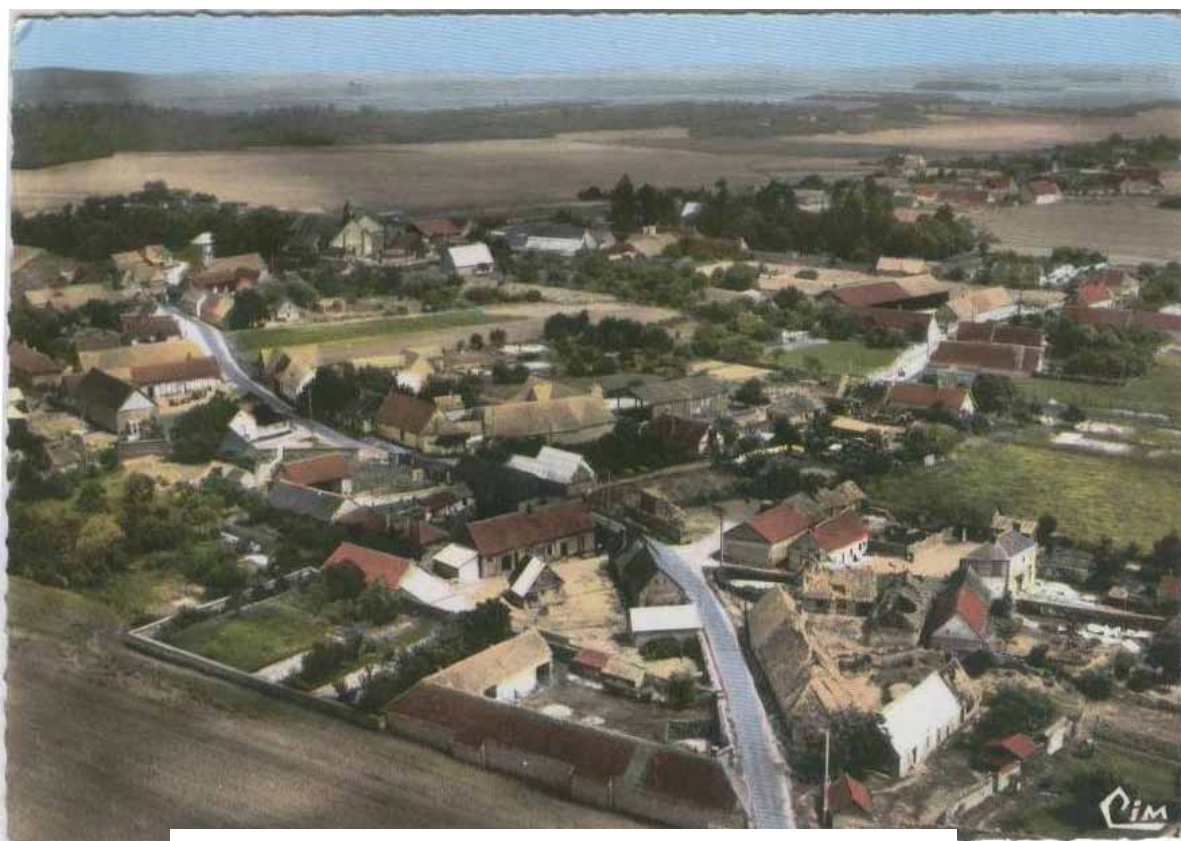
Pour comparer avec la couverture Berchères en 1967