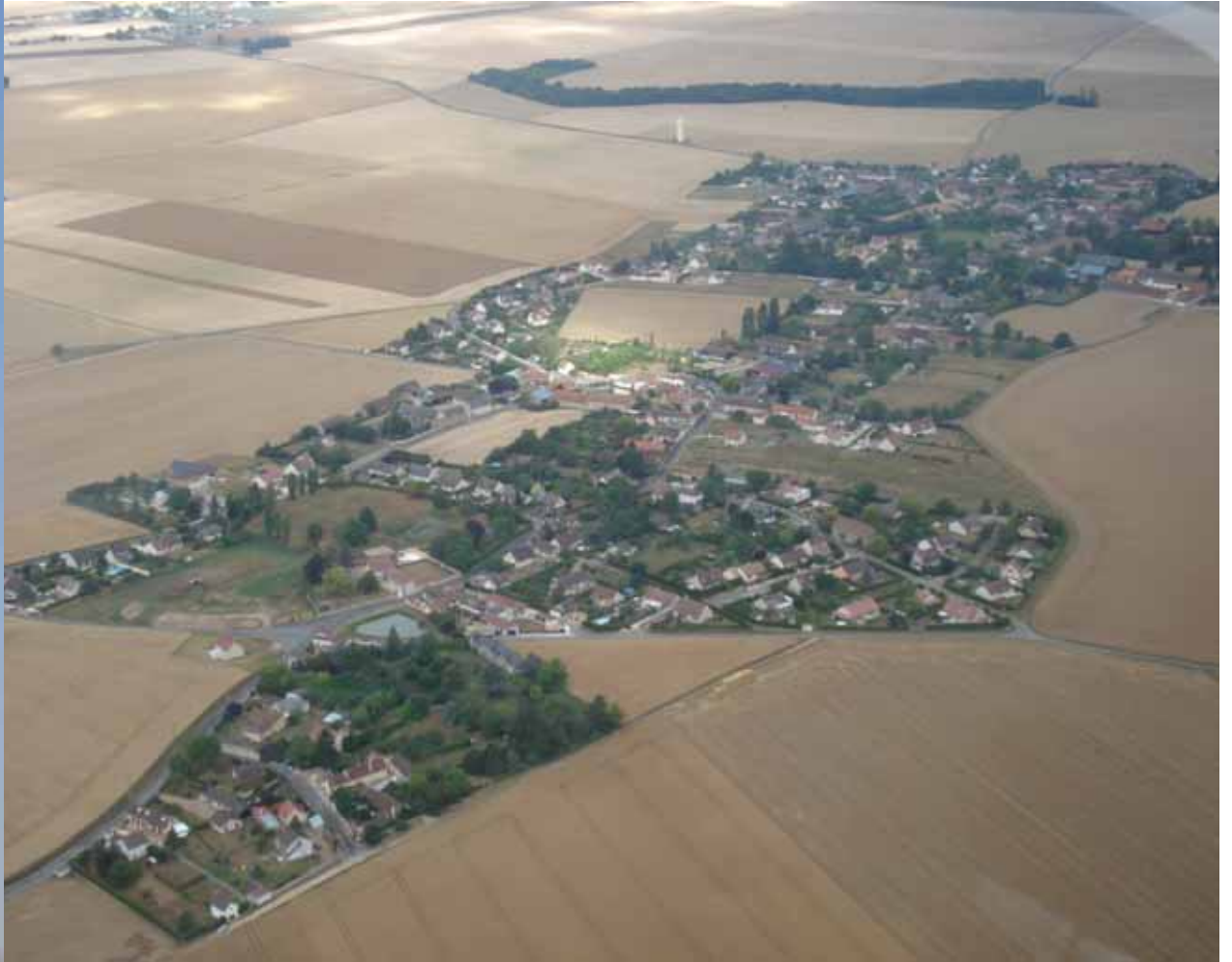
Berchères Saint Germain vue du ciel, juillet 2011