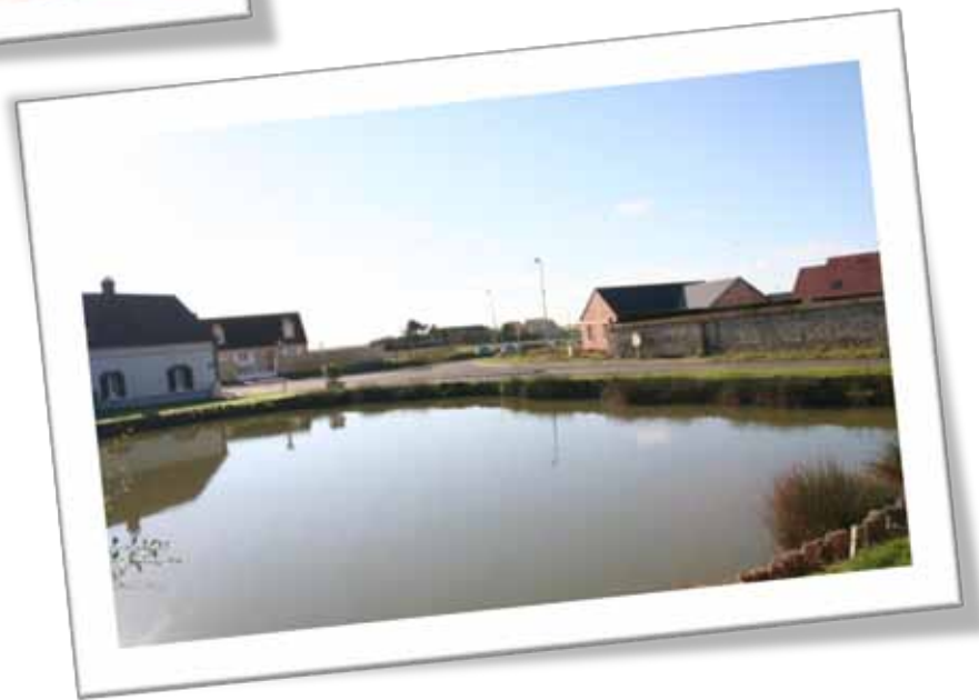
La mare de Panama en 2014