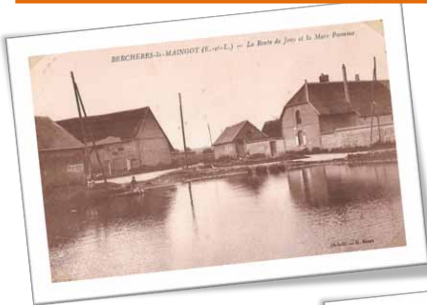
La mare de Panama en 1935